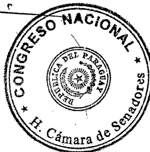
Fernando Lugo Méndez Presidente H. Cámara de Senadores